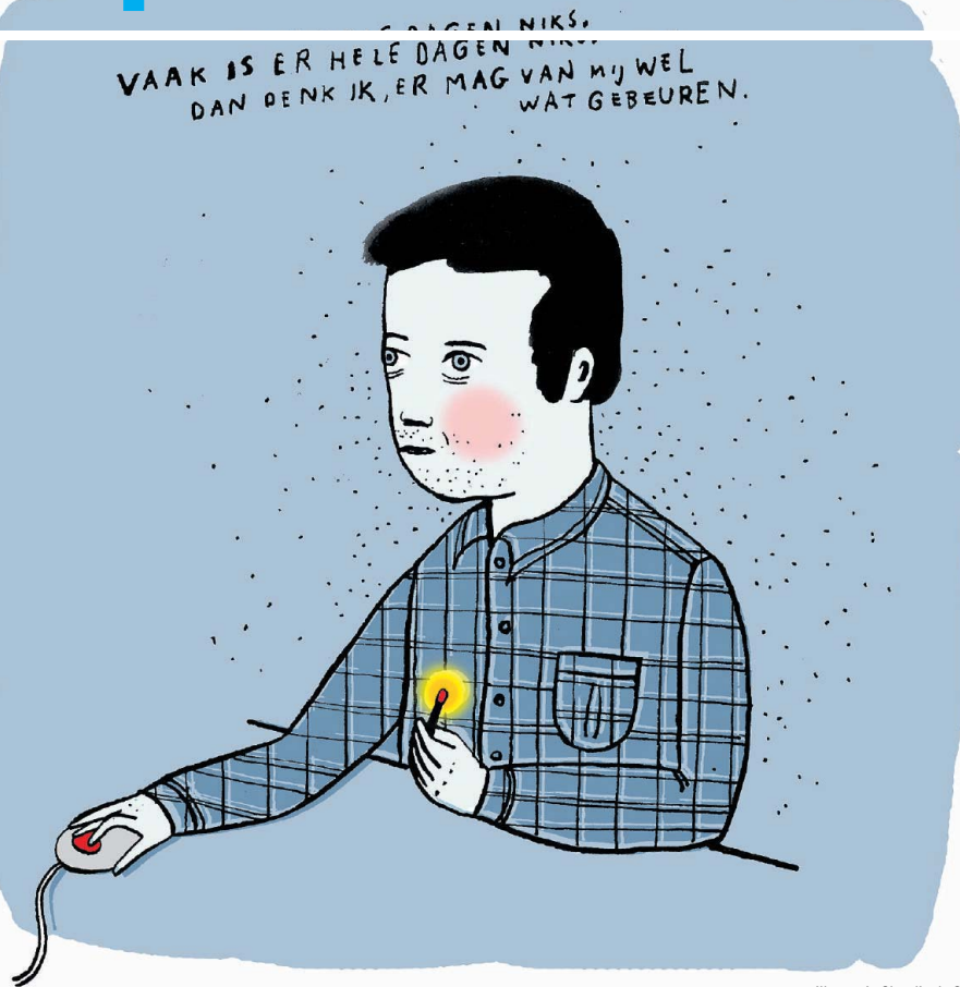
Illustratie Claudie de Cleen